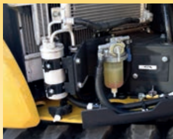
Grande filtro e prefiltro del carburante con separatore di acqua per proteggere il motore