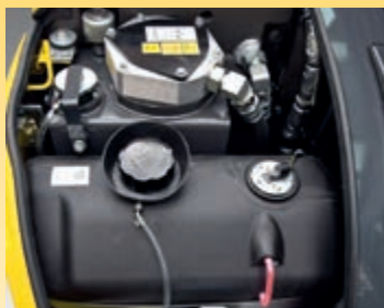
Rifornimento comodo e sicuro di olio e carburante sotto il cofano anteriore