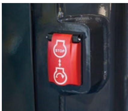
Interruttore secondario di spegnimento motore