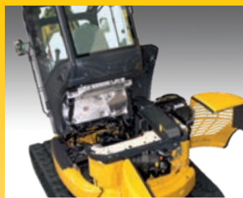
La manutenzione straordinaria può essere effettuata semplicemente ribaltando la cabina