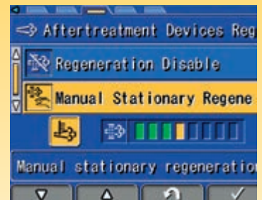
Schermata di rigenerazione del sistema post-trattamento per il DPF