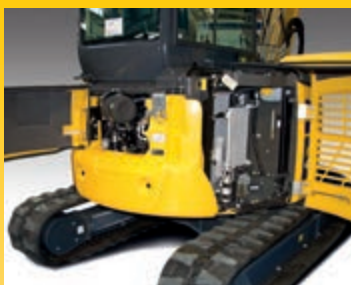
Cofani posteriori per controllo del motore, rifornimento carburante, ispezione e pulizia dei radiatori ed accesso alla batteria

Tutti i punti di ispezione periodica sono comodamente raggiungibili attraverso i cofani. I serbatoi del gasolio e dell'olio idraulico sono collocati sotto il cofano laterale in posizione sicura e facilmente accessibile. Boccole ad alta durabilità e un intervallo di 500 ore per la sostituzione dell'olio motore riducono ulteriormente i costi operativi.