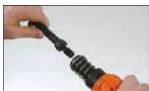
2. Sfilare il pistone con la molla in gomma