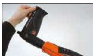
1. Svitare il caricatore