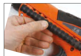
5. Controllare l'usura della molla sulla scala graduata. Sostituire almeno ogni 2.000 colpi.