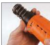
3. Svitare la canna