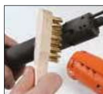
4. Spazzolare l'esterno e l'interno della canna