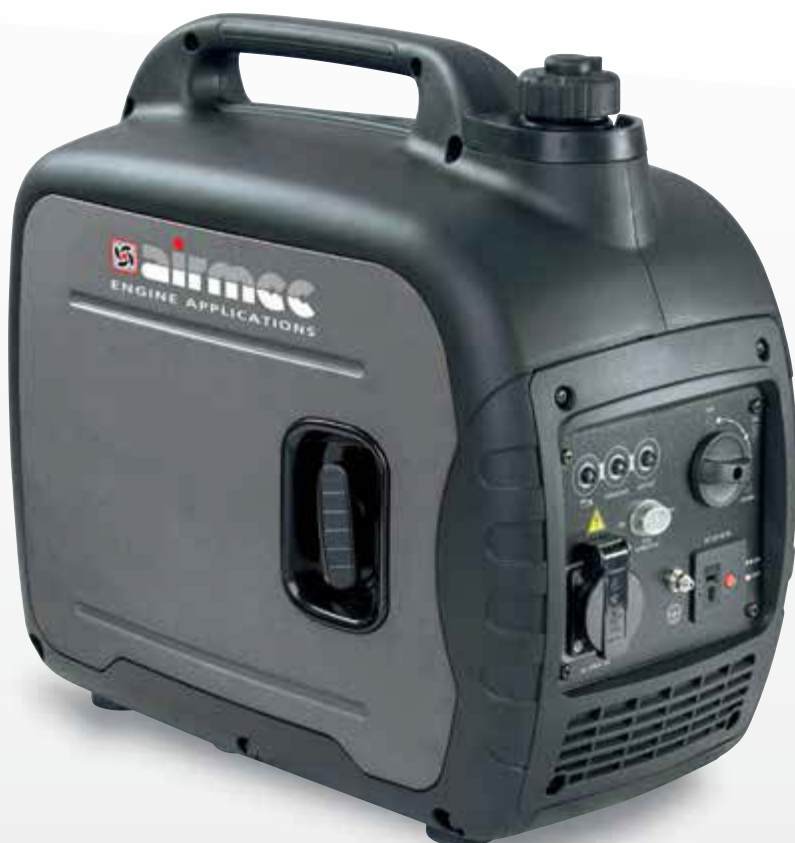
Versione LC 2000 I LC 2000 I version