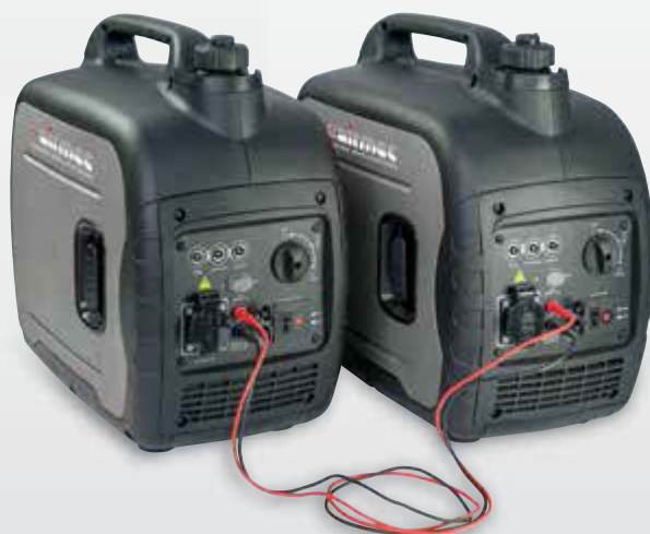
Versione LC 2000 IP collegabile in parallelo LC 2000 IP version connected in parallel