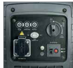
Versione LC 2000 IP LC 2000 IP version